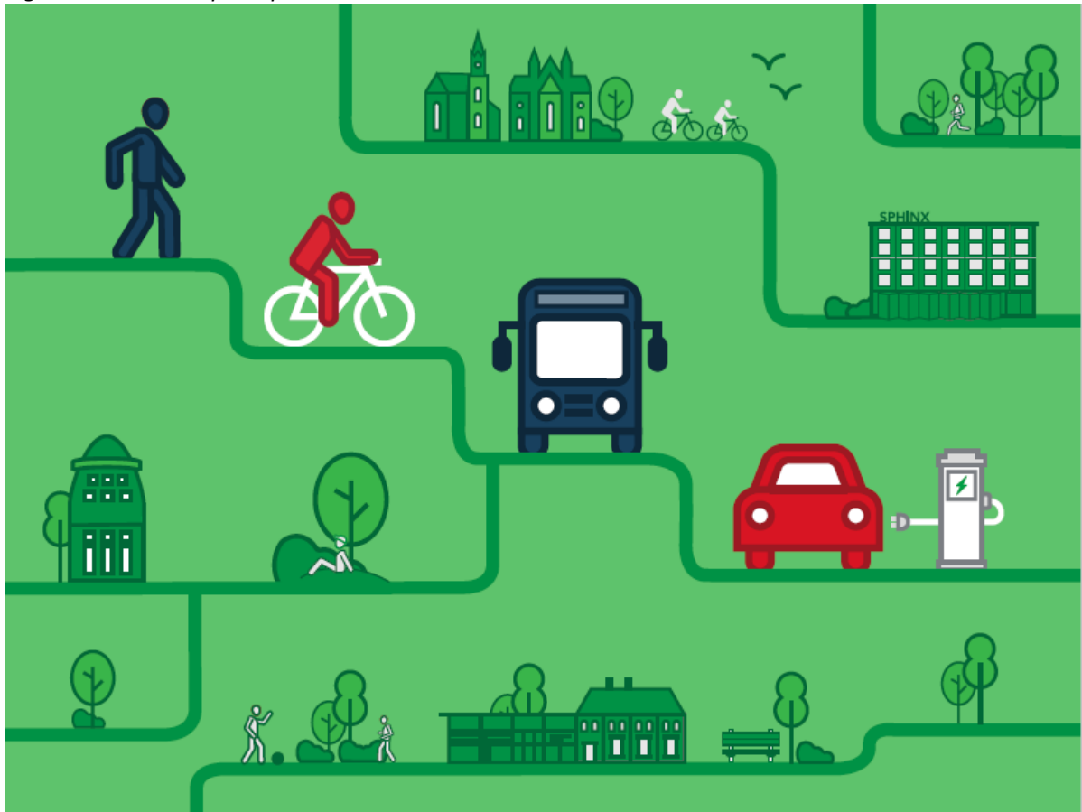
Figuur 1: het STOP-principe

gezonde en actieve manier om ons te verplaatsen. Een pad dat ons leidt naar een goed bereikbare, klimaatneutrale stad waar het prettig is om in te wonen, te werken en te recreëren.